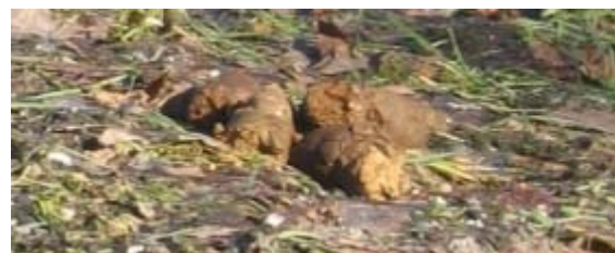
(Foto einer Beschwerde aus Griesbach – neben Schulbushaltestelle)

Bitte beachten Sie, dass mit mitgeführten Kottüten die Verunreinigung durch den Hundebesitzer beseitigt werden muss.