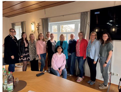
Foto: Frau Nägele von der AKDB sitzend und die Teilnehmer der Verwaltung und Kitas.

Die Teilnehmerinnen waren sehr zufrieden mit diesem gemeinsamen Schultag und waren sich einig, dass man diese interkommunale Zusammenarbeit in den folgenden Jahren weiterführen möchte.