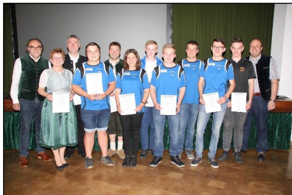
(Sportlerehrung 2018)

Nächstes Jahr wird zum fünften Mal die Sportlerehrung des Marktes Reisbach durchgeführt.