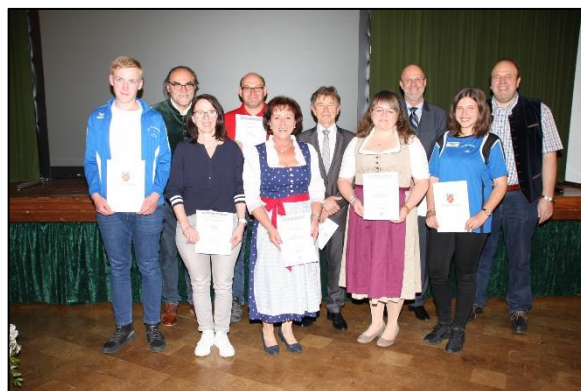
(Sportlerehrung 2018)

Aus allen gemeldeten Sportlern kann die Jury jeweils 1 Sportler und 1 Sportlerin des Jahres unabhängig von deren sportlichen Leistungen wählen.