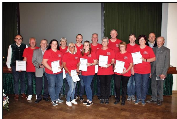
(Sportlerehrung 2018)

Vereine können Vorschläge einreichen, wenn eine Mannschaft den 1. Platz oder den Aufstieg in eine höhere Liga erreicht hat. Pro Verein kann 1 Vorschlag gemeldet werden. Es wird 1 Mannschaft des Jahres ausgewählt. Die Auswahl trifft eine Jury, die vom Marktgemeinderat bestellt wird.