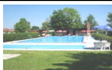
Personen über 16 Jahre:

Ab 11:30 Uhr Grillfest der Schützengesellschaft Bavaria-Reisbach im Schützenhaus an der Eggenfeldener Straße. Einladung ergeht an alle.